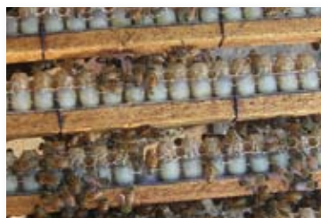
Cuadros con celdas llenas de jalea real listas para ser vaciadas. La operación se realizará manualmente por el apicultor con cucharillas especiales