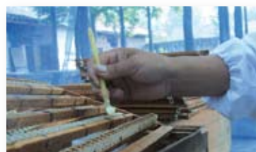
Cosecha de la Jalea Real efectuada manualmente por el apicultor.