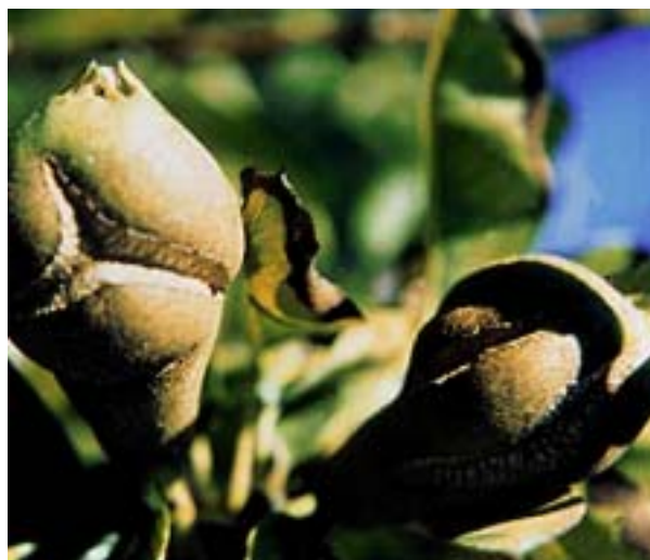
Deficiencia de boro en peral. Deformación de frutos.

línicos. Las aplicaciones de boro mejoran la apetencia de los insectos polinizadores (abejas) por las flores, ya que resulta aumentado el nivel de néctar y se acorta la longitud del tubo de la corola, mostrándose las flores más atractivas para las abejas.