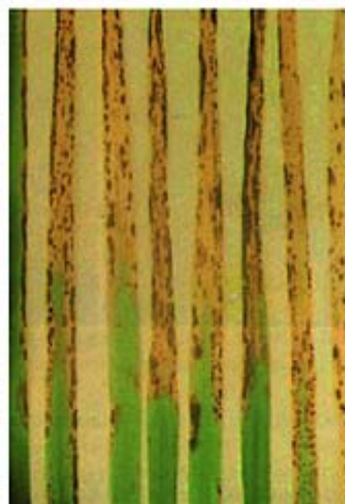
Intoxicación por boro en cebada.