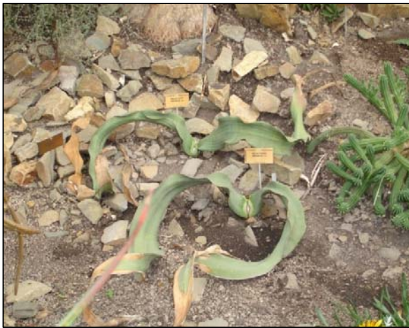
a. Aspecto de la planta con las hojas desgarradas