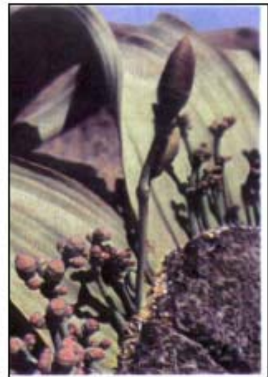
b. Estróbilos megasporangiados