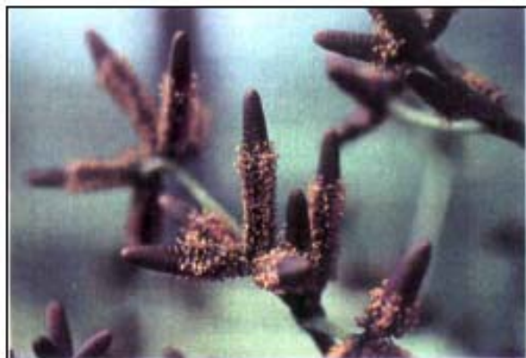
c. Estróbilos microsporangiados