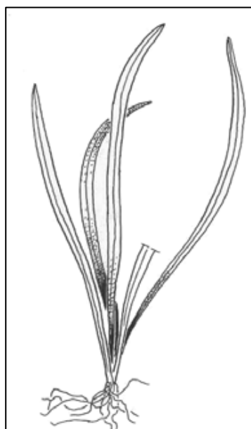
Planta con hojas enteras