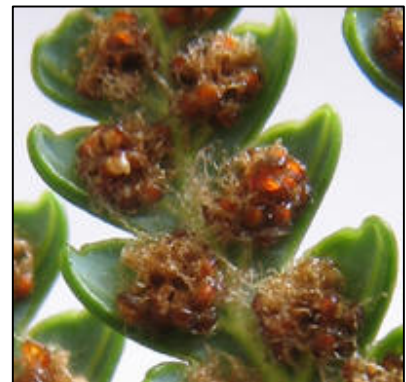
d. Detalle de los soros