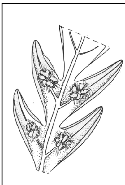
Detalle de los soros con paráfisis en la cara abaxial