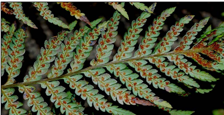
c. Fronde fértil