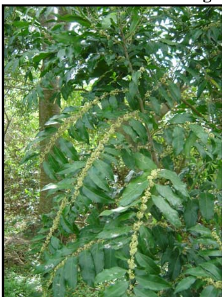
a. Aspecto general de la planta