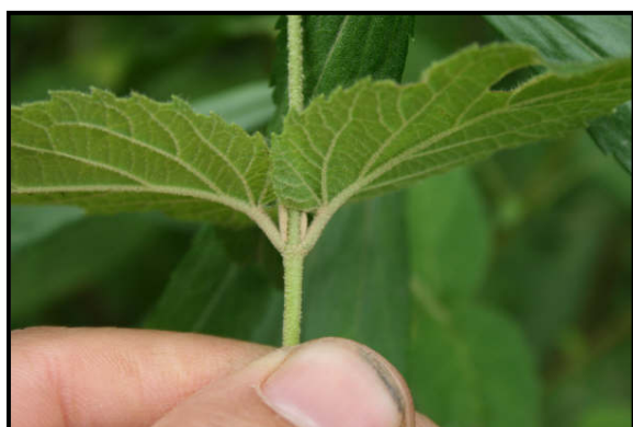
a. Detalle de las hojas