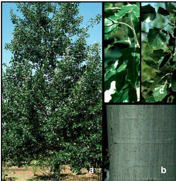
Fig. 5: Populus alba