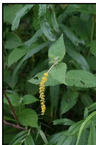
b. Detalle de las inflorescencias estaminadas