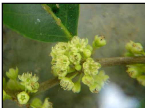
c. Detalle de las flores