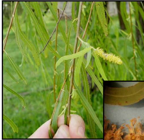
b. Detalle de rama fértil