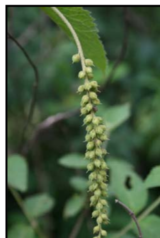
c. Detalle de las inflorescencias pistiladas