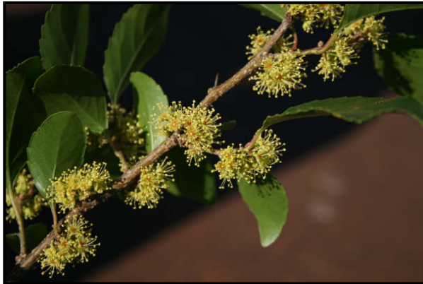
a. Detalle de las flores