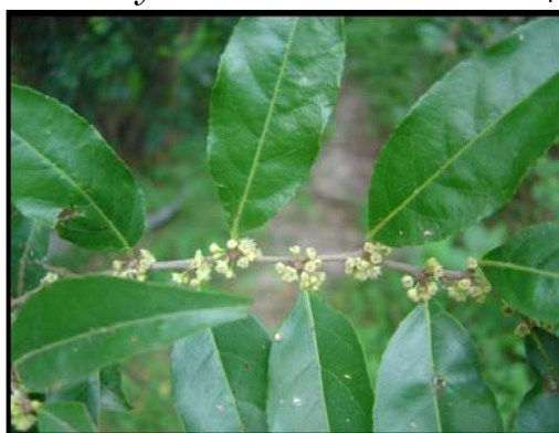
b. Detalle de la rama con flores