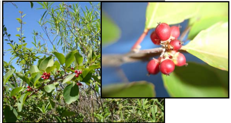
b. Detalle de la rama con frutos