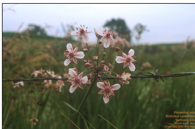
b. Detalle de la inflorescencia (Extraída de

(Extraída de: http://aquat1.ifas.ufl.edu/butumb.html )