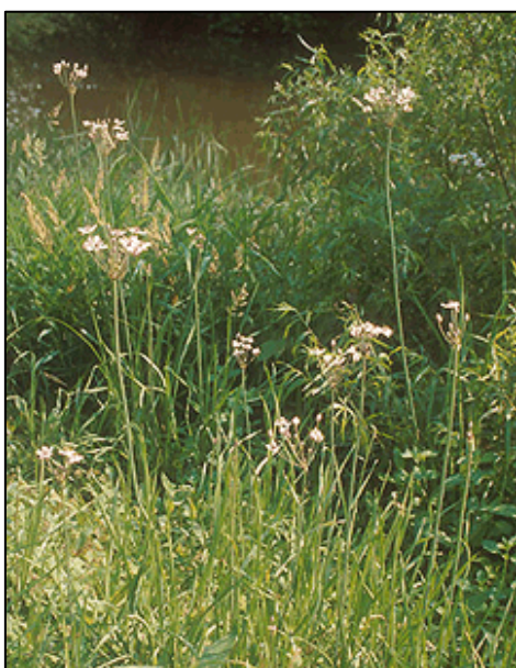
a. Aspecto general de la planta