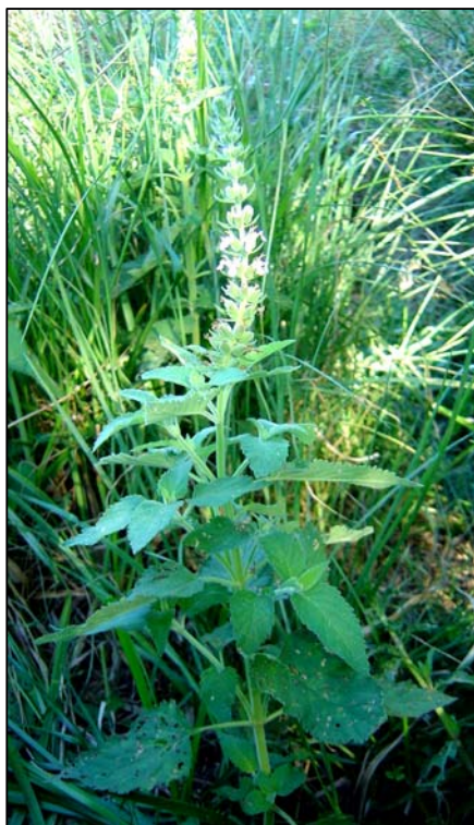
a. Aspecto general de la planta