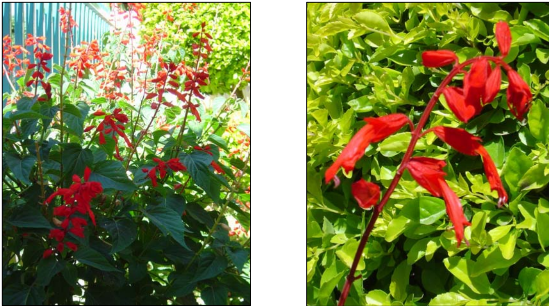
a. Aspecto general de la planta