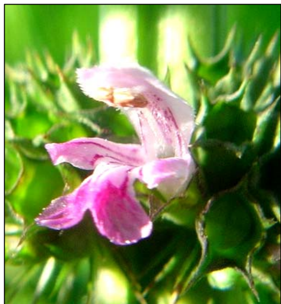
b. Detalle de la flor (4x)