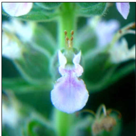
b. Detalle de la flor con los estambres (4x)