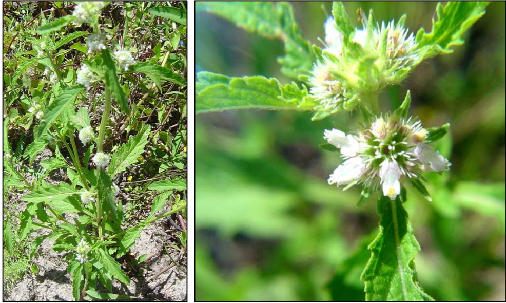
a. Aspecto general de la planta