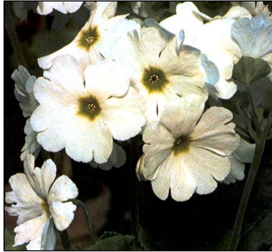
Fig. 3: Primula obconica