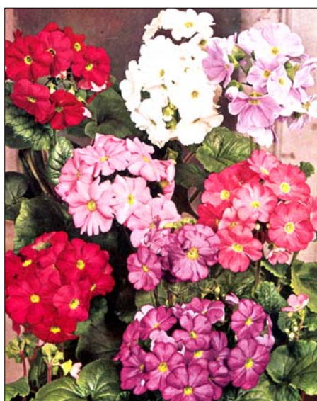
a. Rama con flores